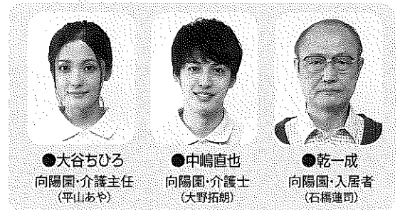
●大谷ちひろ 向陽園・介護主任 (平山あや)

翌日から直也は欠勤。直也の母が退職願を持って「向陽園」を訪れ、直也がアスペルガー症候群であることを告白する。いったん退職願を受理したものの、ちひろは直也をこのまま辞めさせていいものか悩む。そしてちひろは、直也が乾を金山川へ連れていった理由を聞くため、入院中の乾を訪ねたのであった……。